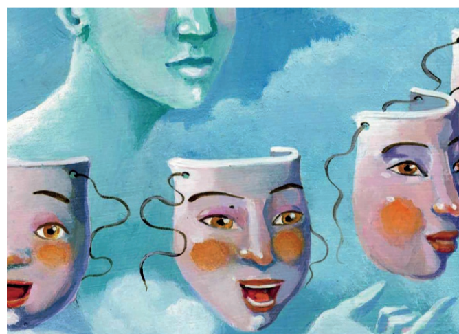
LE TERAPIE CLASSICHE VENGONO ARRICCHITE DALLE NUOVE TECNICHE CBT

complessità del comportamento umano, i docenti non si limitano ad impartire e praticare le classiche tecniche comportamentali e cognitive, ma anche nuove tecniche, anche esse validate scientificamente, e quindi efficaci per i pazienti, basate sull'utilizzo di apparecchiature elettroniche quale il neurofeedback e gli ambienti virtuali. A titolo esemplificativo, infatti, basti pensare al fatto che oggi la scienza mette a disposizione tecniche molto efficaci e brevi, quale la possibilità di guarire molte fobie in una sola seduta.